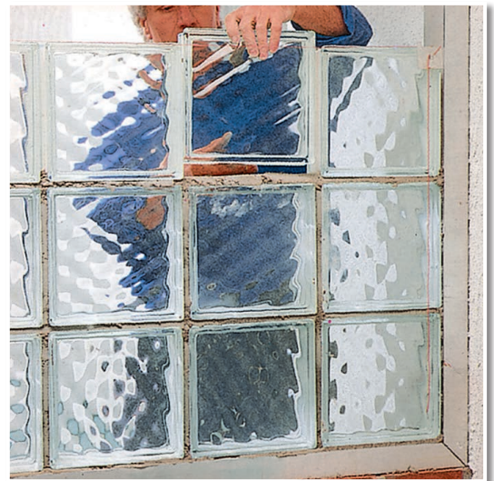
Ideal auch zum Setzen von Glasbausteinen.

Innen und außen. An Boden, Wand und Decke.